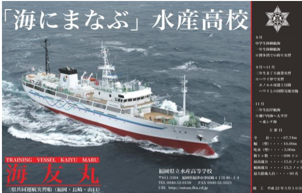
実習船「海友丸」(698トン。福岡・長崎・山口三県共同運航)

本校は昭和28年に開校し、今年で70年を迎えます。3科7コースを有した県下唯一の水産高校です。卒業生は、日本全国だけでなく、海外でも活躍しています。