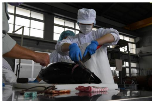
漁業実習で捕れたマグロをさばいて缶詰に加工