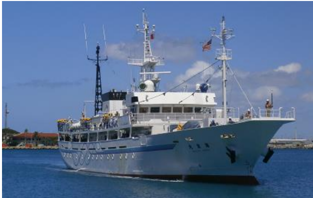
実習船「海友丸(698トン)」(福岡・長崎・山口三県共同運航)

本校は昭和28年に開校し、今年で66年を迎えます。3科7コースを有した県下唯一の水産高校です。卒業生は、日本全国だけでなく、海外でも活躍しています。