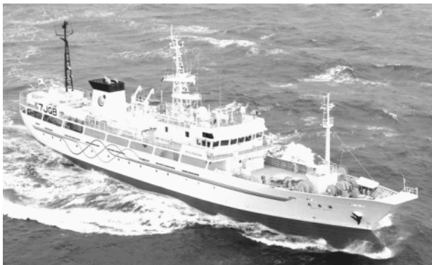
実習船「海友丸(698トン)」(福岡・長崎・山口三県共同運航)

本校は昭和28年に開校し、今年で61年を迎えます。現在、3科7コースを有し、県下唯一の水産高校です。卒業生は、日本全国はもとより、海外でも活躍しています。