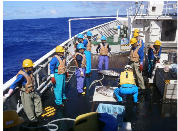
ハワイ沖マグロはえ縄漁業実習