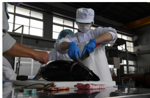
漁業実習で捕れたマグロをさばいて缶詰に加工