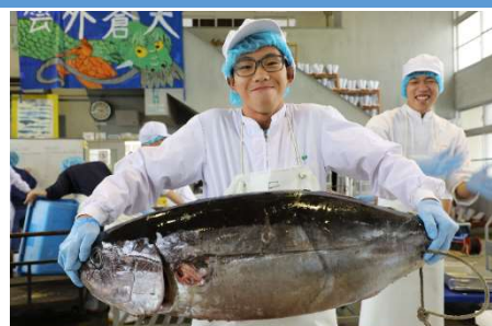
〈漁業実習で捕れたマグロをさばいて缶詰に加工〉