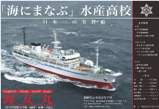
実習船「海友丸(698トン)」(福岡・長崎・山口三県共同運航)

本校は昭和28年に開校し、今年で67年を迎えます。3科7コースを有した県下唯一の水産高校です。卒業生は、日本全国だけでなく、海外でも活躍しています。