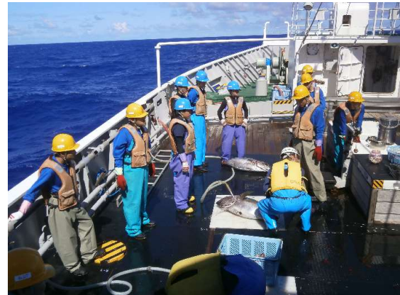
〈ハワイ沖マグロはえ縄漁業実習〉