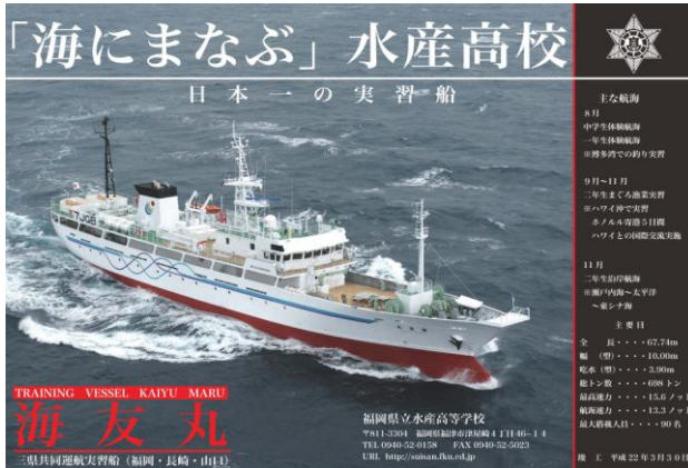
実習船「海友丸(698トン)」(福岡・長崎・山口三県共同運航)

本校は昭和28年に開校し、今年で64年を迎えます。3科7コースを有した県下唯一の水産高校です。卒業生は、日本全国だけでなく、海外でも活躍しています。